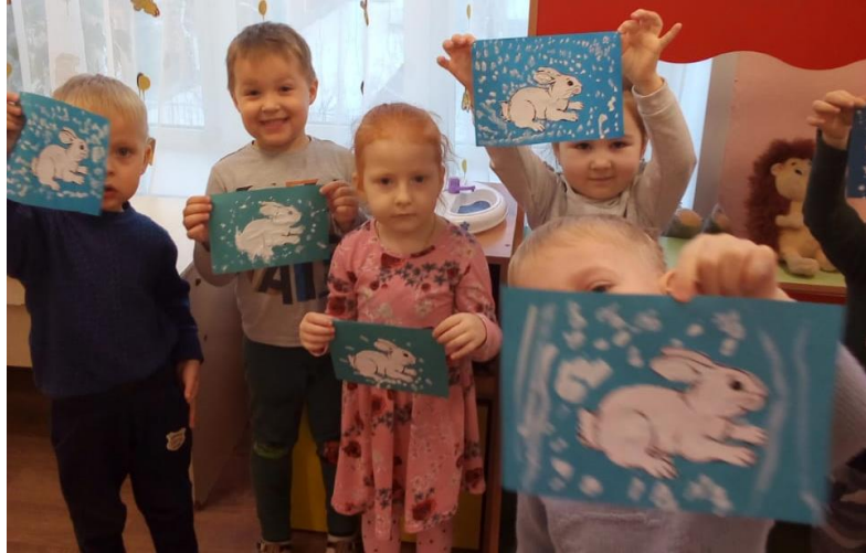
Коллективная работа «Снег-снежок» (дети делают снежок из ваты)