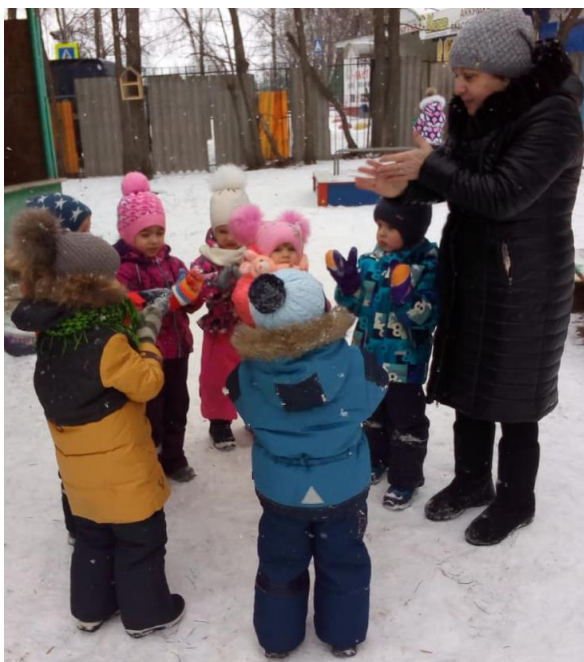
Игра «Мы шагаем по дорожке»