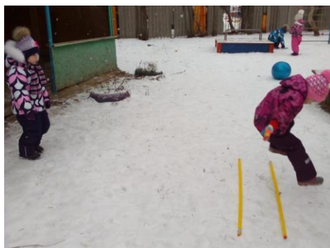
Игра «Мы мороза не боимся»